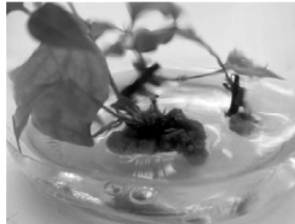
图1 扭肚藤的增殖培养

4.3 生根培养与移栽 将芽丛中高2~3 cm的无根苗切下, 转接至生根培养基(3)上进行培养, 14 d后开始发根。其中以MS+NAA 0.5培养基上诱导的根较其他培养基上粗壮, 生根率最高, 达82%(图2)。当根长至2~3 cm时, 打开瓶盖, 室内自然光照下炼苗5 d后可将小苗取出, 用自来水冲洗掉附着在苗