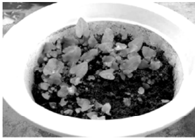
图5 东北对开蕨孢子体植株

5 意义与进展 东北对开蕨别名日本对开蕨、对开蕨,属铁角蕨科( Aspleniaceae )对开蕨属( Phyllitis ),仅一属一种,为国家二级珍稀濒危保护植物。分布