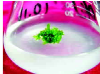
图2 东北对开蕨的原叶体

4.3 孢子体植株诱导 由原叶体向孢子体植株的转化, 是东北对开蕨组织培养过程的一个关键环节。孢子体植株很难在试管内直接产生, 因此采用试管外诱导。将增殖后的原叶体分成 20 片左右的小块,