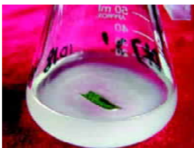
图1 东北对开蕨孢子叶接种

收稿 2008-07-07 修定 2008-07-16 资助 吉林省科技厅青年基金(20000556-2)和吉林省科技厅重大项目(200504163)。