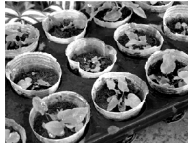
图6 移栽后的东北对开蕨幼苗

范围十分狭窄,主要分布在我国长白山区、日本及朝鲜北部,自然贮量极少,是世界稀有物种。既具有观赏价值,又有药用价值。有关东北对开蕨的研究甚少,其组织培养的研究尚未见报道。本研究为东北对开蕨的保护和利用有一定的参考价值。