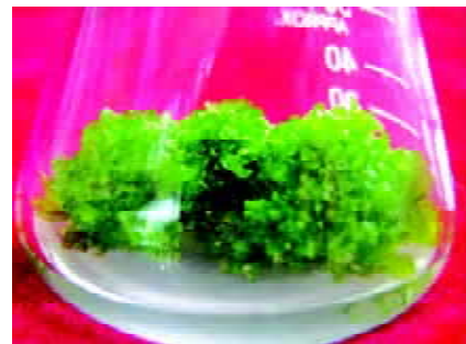
图3 增殖后的东北对开蕨原叶体