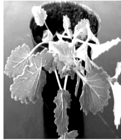
图4 加州蓝铃花的移栽苗

利于提高瓶苗的适应能力。然后用清水清洗干净,水温 20~25 。将分好的苗用 0.1% 代森铵浸根 3~5 min 后移栽。培养基质为草炭土和珍珠岩按 3:1 比例配制的混合土,每天早晚喷水各一次,温度保持在 20~25 ,空气湿度为 70%~80%,光照强度为 85\sim 100\ \mu\text{mol}\cdot\text{m}^{-2}\cdot\text{s}^{-1} , 1 个月后移栽成活率可达到 95% 以上(图 4)。