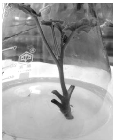
图1 加州蓝铃花无根幼苗

4.3 生根培养 将长至 3~5 cm 高的组培苗接种于培养基(3)中。10 d 左右, 苗基部根原基突起; 20 d 左右, 从根原基上长出白色新根, 每株生根 8~10 条, 根长 3.0~5.0 cm (图 3), 35 d 后根变黑变粗, 生根率达 100%。