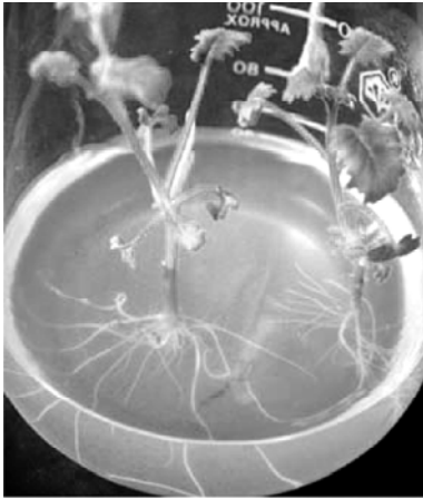
图3 加州蓝铃花的生根培养