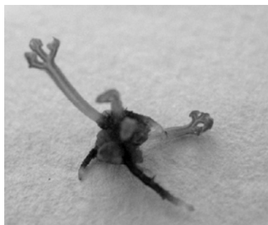
图3 大半边旗愈伤组织诱导的孢子体

农药达克宁的腐殖土:珍珠岩:园土(2:1:1)的苗床中, 浇透水, 适当遮荫保湿度。成活率可以达到70%以上。