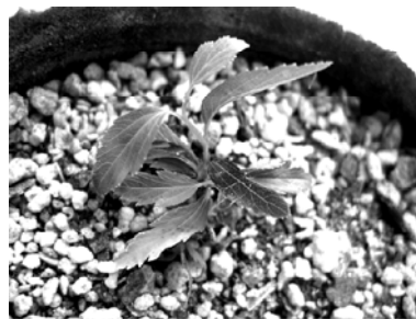
图5 麻叶绣线菊的移栽苗

5 意义与进展 麻叶绣线菊属蔷薇科绣线菊属植物。伞形花序, 花序密集, 花色洁白, 是春天里最美的观花灌木之一。它有纤弱的小枝和叶子, 托着洁白俏丽的花朵, 适宜于在路边种植、草坪边植。在古典园林与现代园林中, 常与红枫