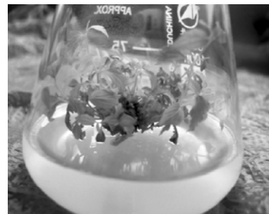
图2 麻叶绣线菊的芽增殖培养