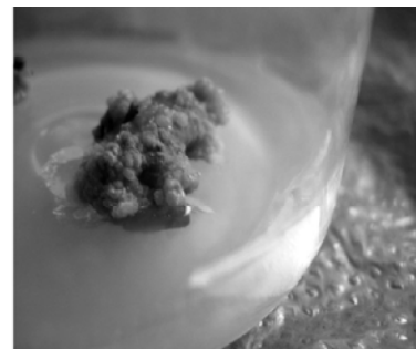
图3 麻叶绣线菊的愈伤组织诱导培养