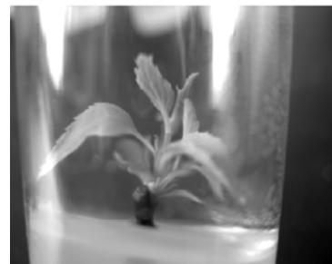
图1 麻叶绣线菊的芽诱导培养

4.2 芽的诱导与增殖 将已消毒的茎段剪成 1 cm 左右、带一个腋芽的节段, 接种到培养基(1)中。约 7 d 茎段腋芽处开始萌动, 再过 10 d 腋芽长出, 30 d 后形成高 2~3 cm 的小苗(图 1)。将小苗接种于培养基(2)中进行增殖培养, 35 d 后诱导出大量的丛生芽(图 2), 增殖倍数为 5.36, 芽苗生长健壮。 4.3 愈伤组织诱导与分化 将消毒的叶片剪成边长为 0.5~1.0 cm 大小的方块, 接种到培养基(3)上。培养 2 周后叶片开始膨大卷曲, 20 d 后叶片边缘出现少量浅绿色愈伤组织, 平均诱导率为 68% (图 3)。将愈伤组织转入培养基(4)中约 7 d 后, 愈伤